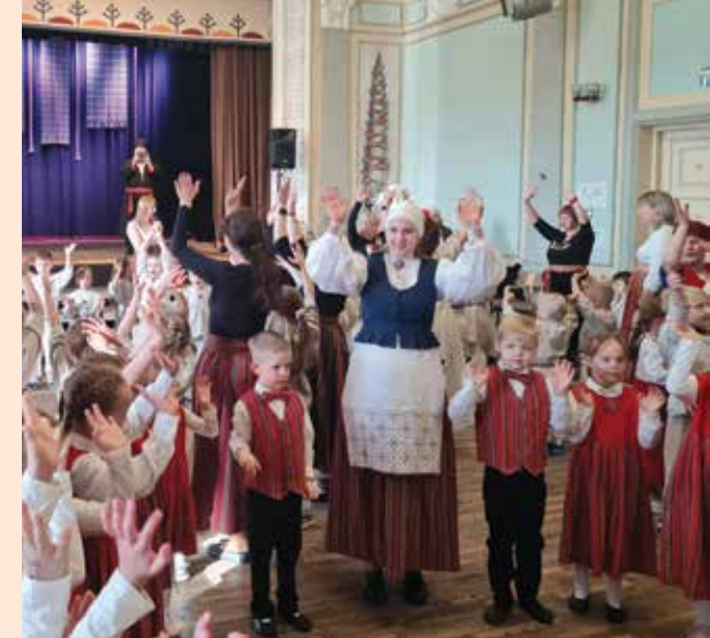
PIDU PÄÄL LUSTI MIILDIP NII SUURDELE KU LASTELE.

Kige suuremb mulke pidu om Mulgi pidu, mida peetes üle kate aaste. Edimene Mulgi pidu sai teos 2010. aastel Karksin ja selle peo mõtel kah Laande Alli vällä. Sii om üits terve pere pidu, kus saave üles astu nii latse, suure ku memmetaadi kah. Ole sa laulje, tantsje või pillituleve, Mulgi pidule olet sa iki oodet. A kes