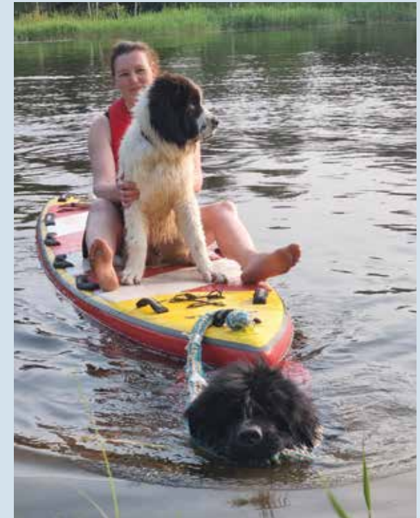
BANDIT TUUP YETI JA TEMÄ PERENAISE KALDA PÄÄLE.