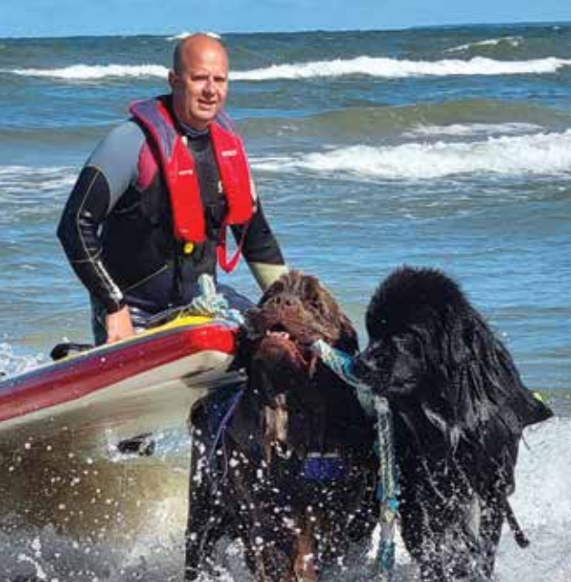
BOSS JA JOKKER TÄÄVE, ET KATEKESTE OM AERULAUDA KERGEMB SIKUTE.

äste söbralik ja tahtma midägi üten inimesegetä.