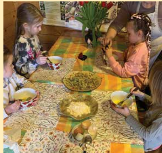
ÜTTE NÄNNIGE OM TORE SÜVVÄ TETÄ.