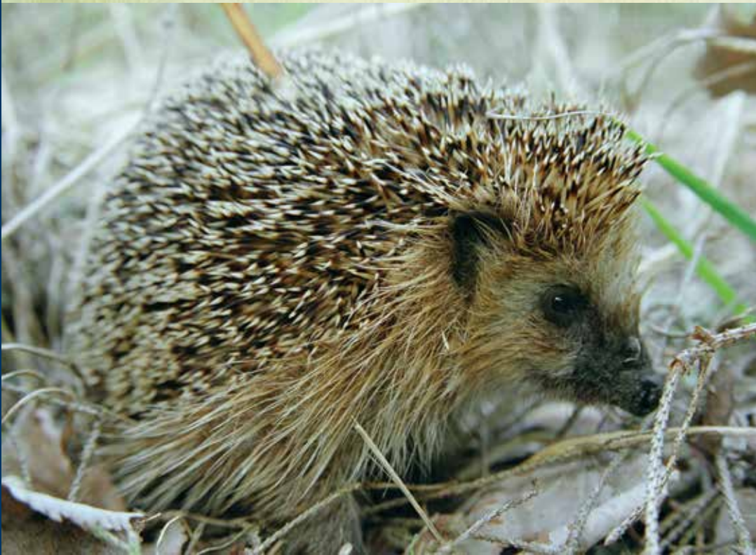
SIILUL OM TERÄVE OKKA JA VÄLE JALA.