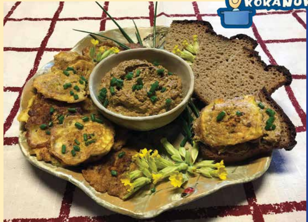
KÜDSÄTET VÕILILL MEKIP LEVÄ PÄÄL ÄÄ.