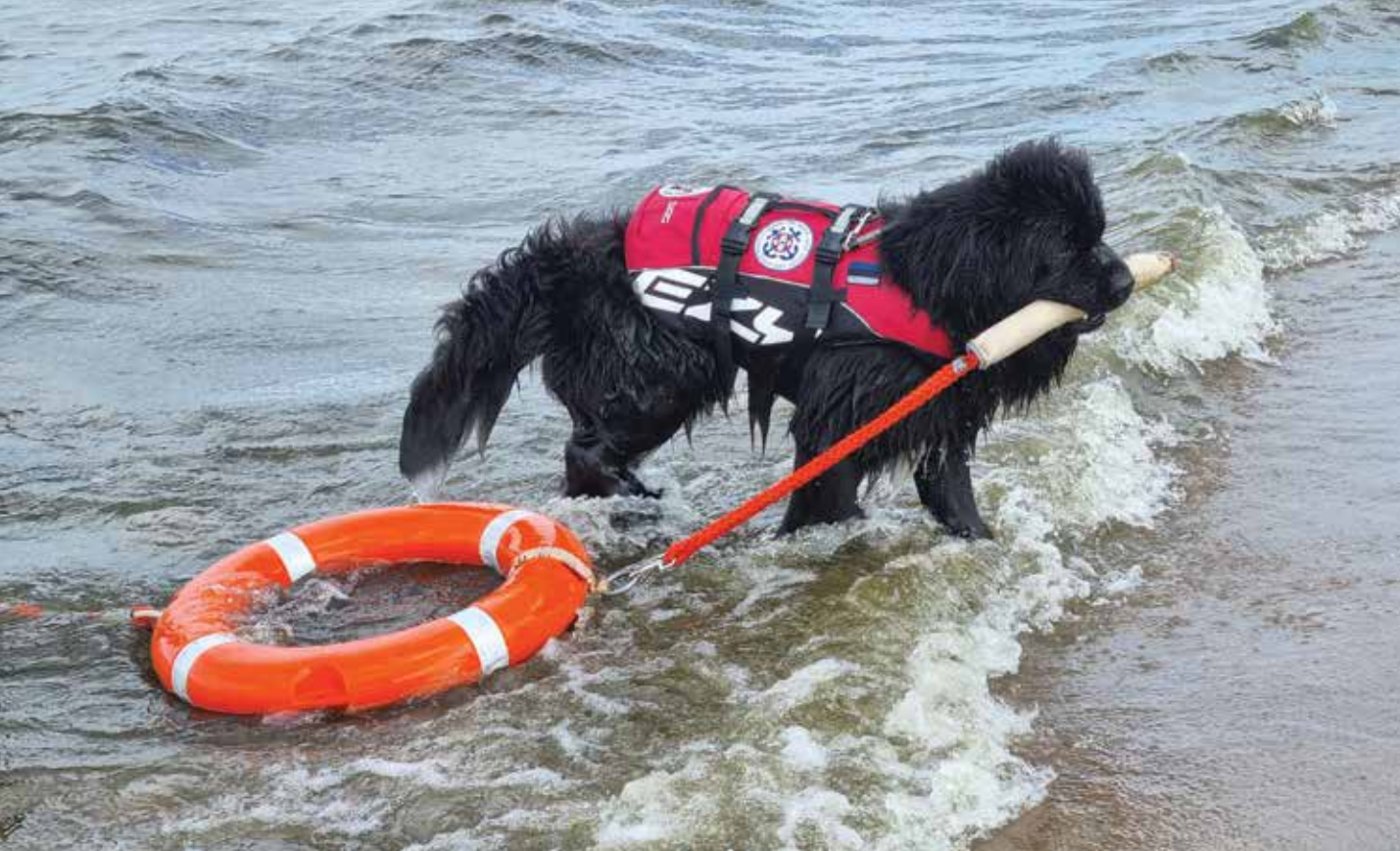
NJUUFA TENSO VIAP PÄÄSTERÖNGAST.