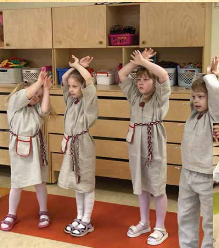
KUDAS TETÄ PERRÄ PÖTRA?

Mängujuht näütäp looma nime ja mängje akkave käsu pääle tegeme looma liigutusi, et arvaje saas aru, kes ta om. Arvaje püünäp sedä luuma ärä arvate. Ütlep selle nime mulgi keelen.