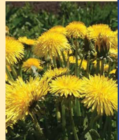
VÕILILL TIIP MAILMA KÖLLATSSES.