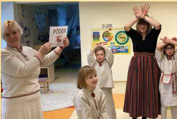
LOOMAMÄNGUGE SAAP ÄSTE MULGI KIILT ÖPPI.