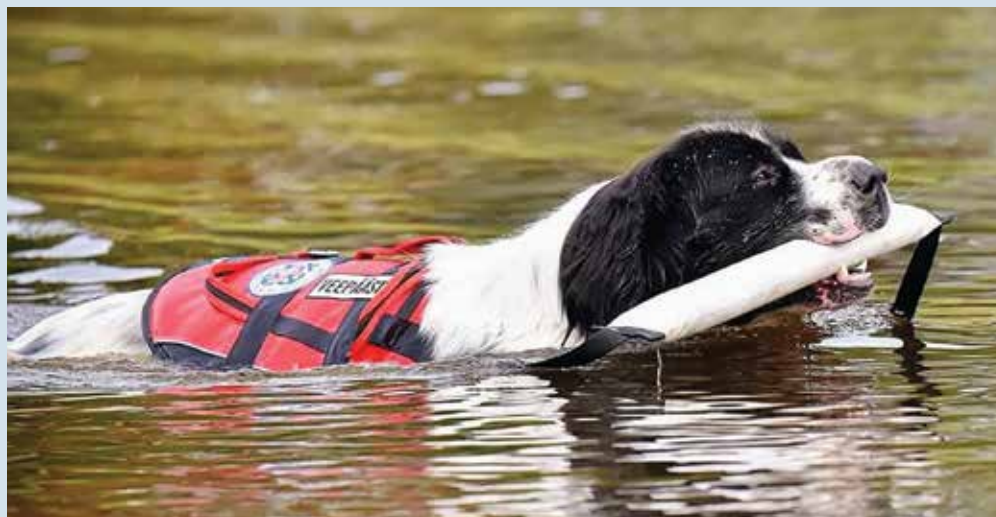
LANDSEERI TÕUGU VIKI TUNNEP ENNEST KU KALA VIIN.

Üldse piave nii koera täadmä pallu käske, oleme julge ja nupuka. Näituses