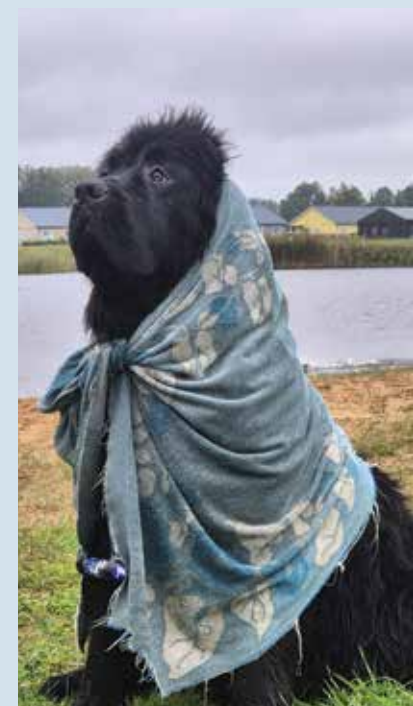
PERÄST OJUMIST KUIVAP PORTHOS SANNALINA SIHEN.