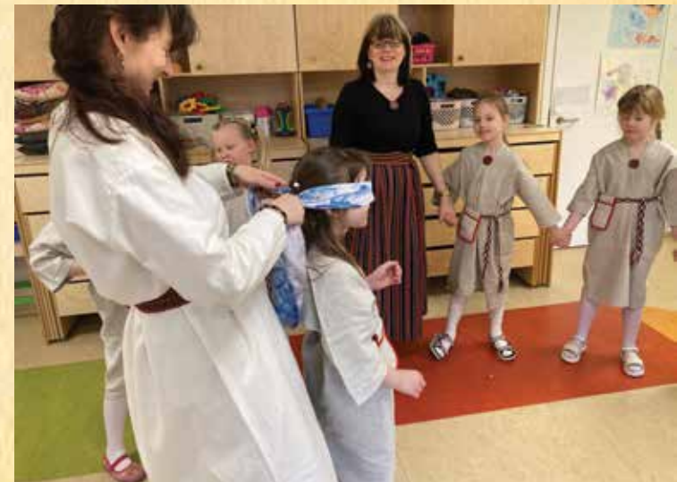
MÄNGUJUHT SEOP PIMESIKUL SILMÄ KINNI.